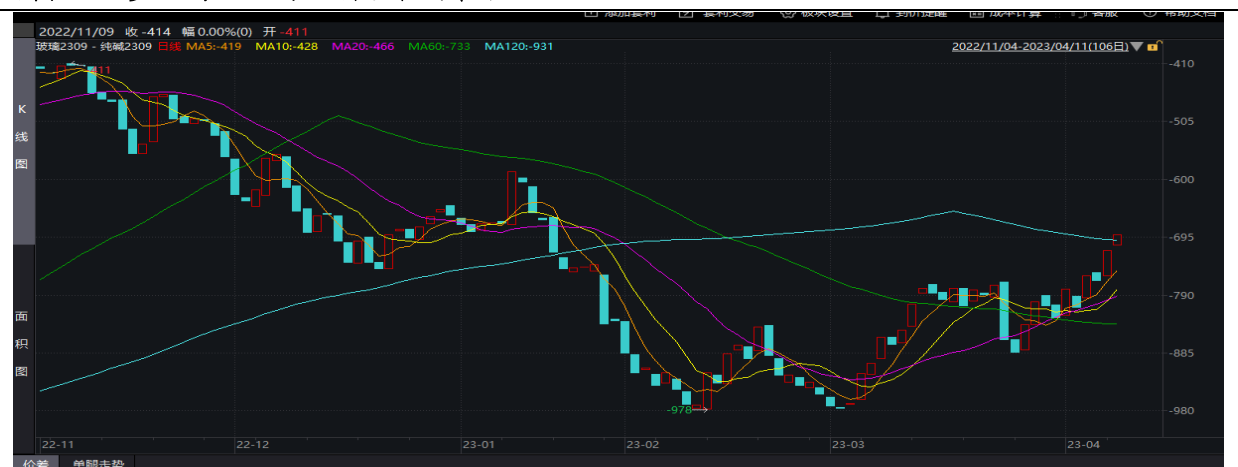
图表 3：多玻璃空纯碱 09 价差合约策略