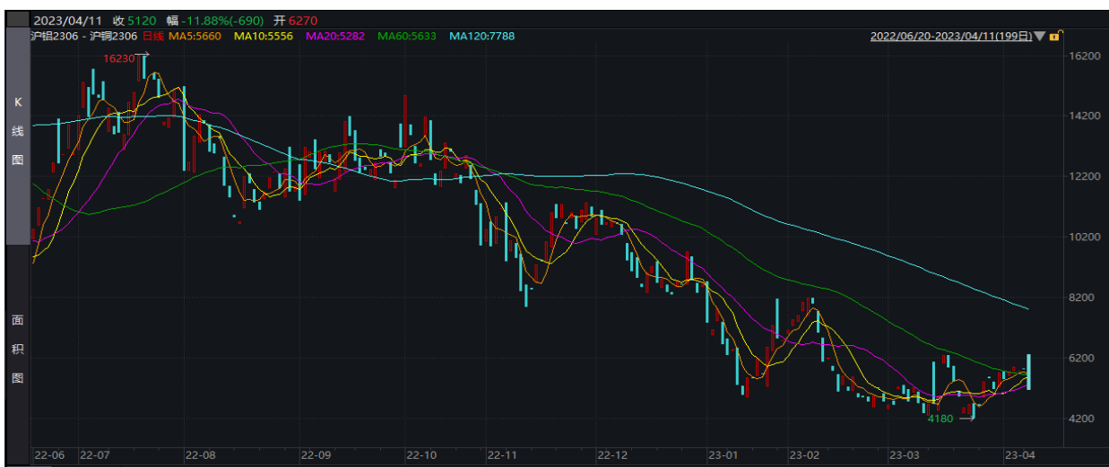
图表 1: (4 吨铝-1 吨铜) 价差走势 (1 年期)

多铝空铜对冲策略逢低介入。结合近期美国经济数据走弱及银行危机压力，预计美联储加息接近尾声，但仍需高利率一段时间来抵抗高通胀。高利率高通胀环境下，美国经济衰退预期进一步强化，铜价中期顶部逐步明晰。相对铜而言，铝价受到宏观因素影响更小一些，更多时候走自身基本面逻辑。铝供应端新增产能少，复产产能进度缓慢，其中云南复产最快需等待5月丰水期，供应压力暂时不大。消费端，消费弱复苏持续，铝锭进入加速连续去库阶段，基本面相对健康，给与铝价支持。