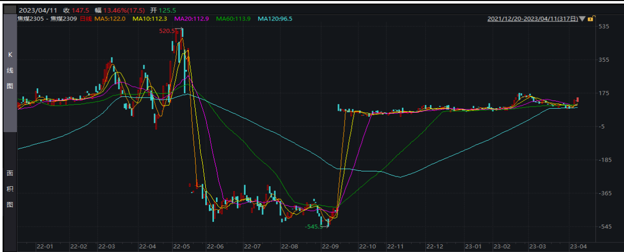
图表 4：逢低做多焦煤 05-09 正套策略