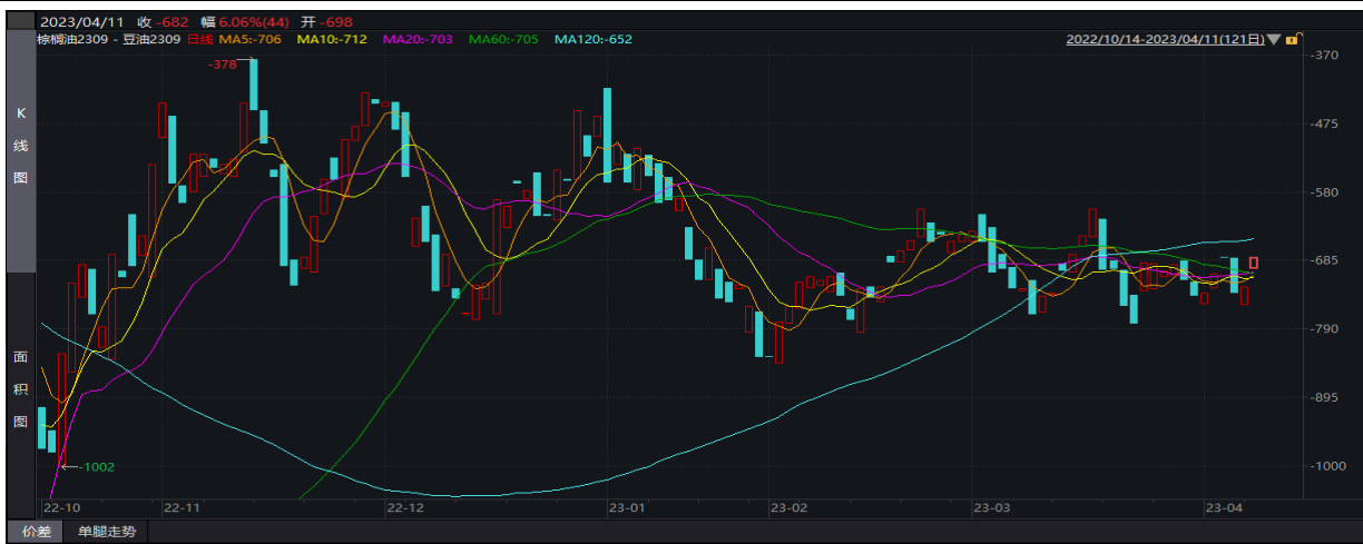
图表 2：空豆油 2309 多棕榈油 2309 套利策略

3) 棕榈油进口利润持续倒挂，近月陆续出现洗船现象，二季度进口量或下滑。在进口减少及需求逐步好转预期下，棕榈油进入去库阶段，而去库速度则取决于消费需求的增量情况。