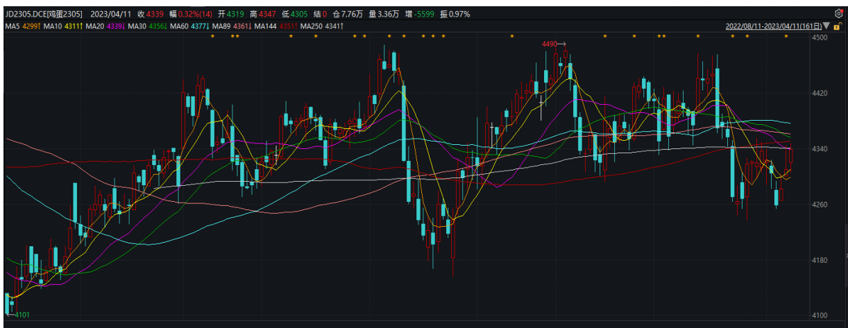
图表9：做多鸡蛋2305合约价格

综上所述，我们倾向于认为，基差处于历史高位，而现货季节性和供需仍支持现货阶段性强势，2305合约基差修复更多通过期价上涨来实现。