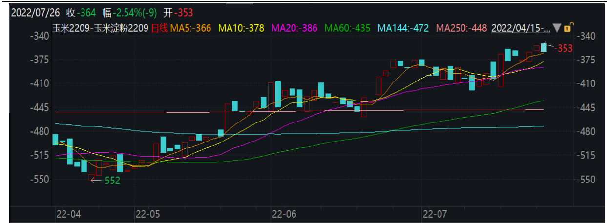
图表1: 多C2209空CS2209价差走势